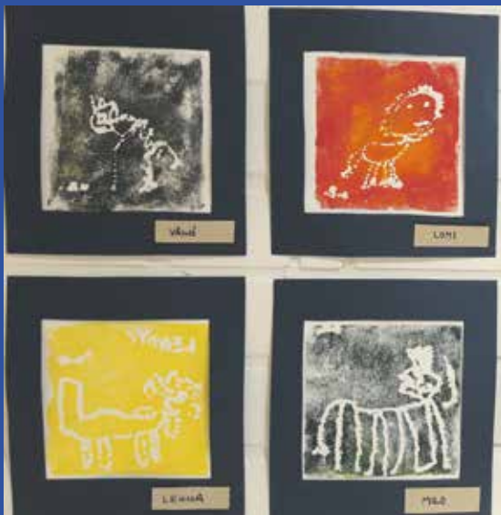
Vaunukankaan päiväkodin Taidepajassa tehtiin Grafiikkaa.

V aunukankaan päiväkodissa toteutetaan Taidepaja-jakso kaksi kertaa vuodessa. Taidepajojen avulla rikastetaan viikoittain toteutettavaa taidekasvatusta tutustumalla eri taiteen tekemisen menetelmiin. Syksyisin valitaan yhteisöllisyyttä tukeva menetelmä, ja lapset tekevät taideteoksen yhteistyönä. Keväisin jokainen lapsi tekee oman teoksen. Syksyllä 2018 tutustuttiin pastelliliitujen käyttöön ja keväällä 2019 tehtiin grafiikkaa monotypiaa ja laakapainoa hyödyntäen.