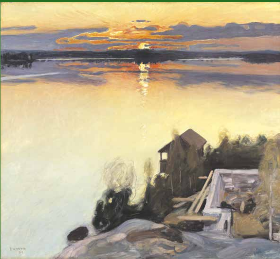
Pekka Halosen Auringonlasku Tuusulanjärvellä vuodelta 1902 esittelee Halosenniemen rakentamisen vaiheita.

Halosenniemi oli viime vuonna kävijä- määränsä perusteella Suomen suosituin taiteilijakotimuseo. Se on edelleen Tuusu- lan museoiden ehdoton helmi. ●