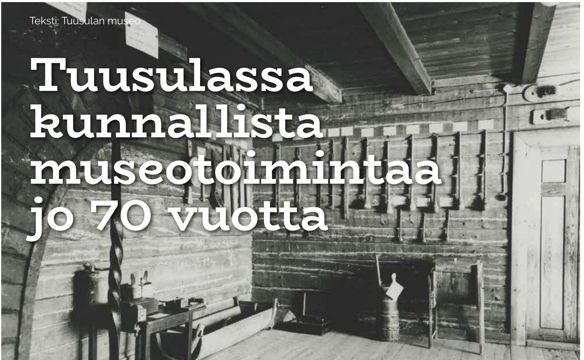
Halosenniemen yläkerrassa oli esillä Tuusulan kotiseutumuseon talonpoikaisesineistöä museotoiminnan alkuvuosikymmeninä.

Tänä vuonna Tuusulan museo juhlii 70-vuotista taivaltaan. Kunnallinen museotoiminta lasketaan alkaneeksi 16.2.1949, jolloin Tuusulan kunta osti Halosenniemen Pekka Halosen perikunnalta. 1980-luvulla museo sai ensimmäisen vakituisen työntekijän. Nykyään Tuusulan museolla on museokohteita yhteensä viisi ja vakituista henkilökuntaa 15 sekä kesäoppaita kymmenen. Museon taide- ja kuvakokoelmat ovat karttuneet vuosien varrella ja mahdollistaneet laajan tutkimus-, opetus- ja näyttelytoiminnan.